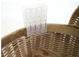
43 まず、上端だけ洗濯ばさみ で止め(2~3分)貼れたら 洗濯ばさみを下へ下す。 これを繰り返す。