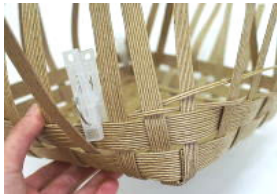
21 ⑧で追いかけて編みをする。