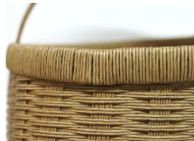
36 口周りの出来上がり。