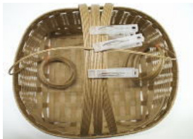
37 持ち手を巻く。持ち手中心 部分を洗濯ばさみで止め ておき、⑫の中心をあて、 左右に巻き下げていく。