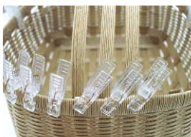
31 ボンドがくっつくまで洗濯ばさみで止めておく。