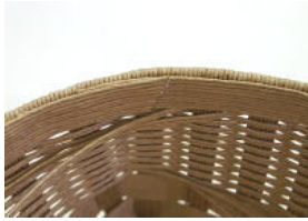
45 ①口まわり内側が貼れた ところ。