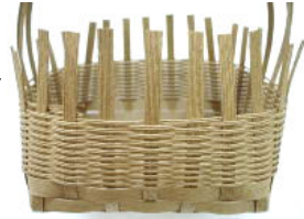
24 全部で20段編んだところ。編み終りはまだボンドで貼らない。