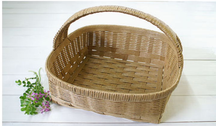
エルくらふとのカゴ No. 501