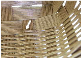
47 カットしたところ。