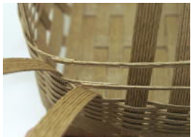
23 ⑧を、つけ足す。切り口が外から見えなようにボンドで貼る。20段になるまで編む。