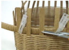
28 口まわりをつける。⑨に⑩を巻いておく。出来上がった⑨を⑧の上ののせ持ち手以外の横ひも 縦ひもを編みひもの1cm上のところでカットする。