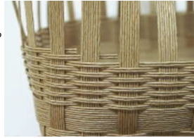
22 途中、⑧が足りなくなる。