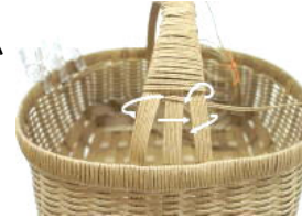
38 途中まで巻いたところ。 3本に分かれているところは 8の字を描くように持ち手芯 に巻いていく。