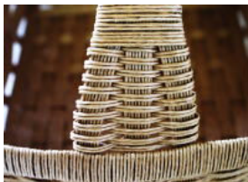
39 三本に分かれている部分 に⑫を巻いたところ。