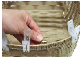
30 横ひも縦ひもの裏側にボンドをつけ⑨に貼る。この時、先端部分10cmと最後尾部分は10cmボンドで貼らない。32参照。