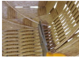
46 編みひもの余分は表から 見て、穴が開かない位置 でカットする。