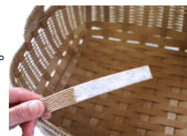
42 口まわりの内側を貼る。 ⑪の裏側前面にボンドを 塗る。この時、15cm位づつ 塗っては貼る。を繰り返す。 口まわりは貼り方でとても きれいに仕上がる。