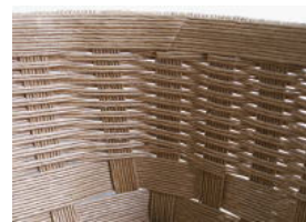
48 カットした部分をボンドで 貼ったところ。