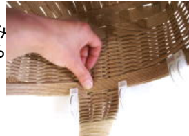
44 持ち手部分は、洗濯ばさみ で止められないので指で押 さえて貼る。