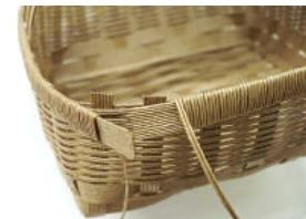
32 先端部分の⑩をほどき、⑨の角をハサミでカットして3.5cm重ねてボンドで貼る。