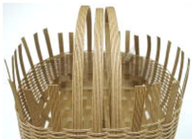
25 片側の持ち手を向かい側の編み目(10段目くらい)に差し込む。このとき先端部分3cmくらいにボンドをつけて貼る。