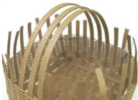
27 持ち手が貼れたところ。