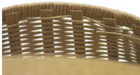
35 ⑩を巻き直したら、まだ 貼ってない縦ひもに⑨を 貼る。