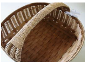
41 ⑫の巻き終わりは・・・ 余分は切って内側に貼る。