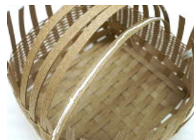
26 片側を貼ったら、もう片側の長さを調節し、上側にボンドをつけて貼りながら、編み目に差し込む。