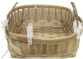
29 洗濯ばさみで⑨を⑧の上に仮止めする。