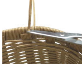
34 ⑨に⑩を巻き直す。 あまりはカットしてボンド で貼る。